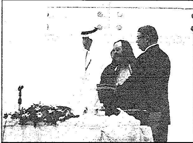
تكريم إحدى المشاركات