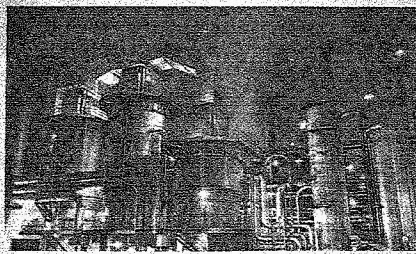
نموذج للملن الصناعية