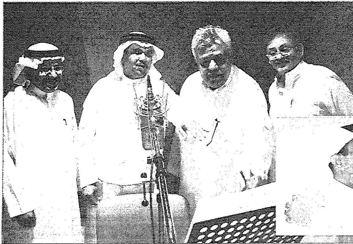
محمد عبده وشفيق أثناء تسجيل الاغنيات بحضور عكاظ

أكمل فنان العرب محمد عبده أمس تسجيل ثلاث أغنيات جديدة خاصة بالقيمة العربية التي ستعقد في الرياض غداً. وكما هو معتاد في مثل هذه المناسبات تصدى لرعاية هذه الاعمال الفنية صاحب السمو الملكي الأمير منصور بن ناصر بن عبدالعزيز الذي قدم مؤخراً عملاً فنياً بصوت محمد عبده أيضاً ومن الحان الموسيقار محمد شفيق وأشاعر معالي الدكتور غازي القصيبي خلال مهرجان التراث والثقافة بالجنادرية..