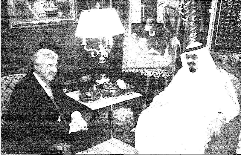
الملك عبد الله أثناء الحوار الذي أجرته معه وكالة إيتار تاس.