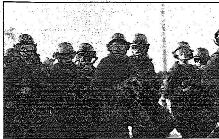
جانب من القوات المشاركة في أمن الحج خلال الاستعراض

احلال وإنشاء عيادات وطوارئ بمستشفى جبل الرحمة الذي بلغت تكايفه أربعة عشر مليوناً و٩٩٥ ألف ريال ويشتمل على بldروم ودور أرضي ودور اول ومواقف للاسعافات ومستودعات ويضم ٢٤ عيادة ومختبراً وقسماً للإشعاع وصيدلية وتبلغ طاقته السريرية ٧٥ سريراً التي جانب مشروع احلال وإنشاء عيادات بمستشفى ثمره بتكلفة تبلغ ٥ ملايين و٧٦٠ ألف ٣٣٠ ريالاً وأقيم على مساحة ١٣٨٥ متراً مربعاً ويشتمل على دور أرضي ودور اول ويضم ١٦ عيادة ومختبراً وقسماً للإشعاع وصيدلية وتبلغ طاقته السريرية ٤٨ سريراً.