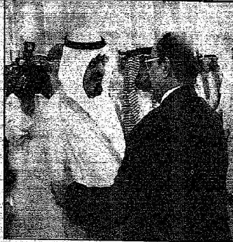
الملك عبدالله بن عبدالعزيز يلتقي نوابي الأئمة والمسلمة في وفد فهد الأمام

المصدر : الرياض التاريخ : 23-08-2005 العدد : 13574 الصفحات : 7 المسلسل : 15