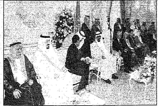
خادم الحرمين مستقبلاً الوفود العربية والإسلامية والصديقة والمواطنين

استقبل وفوداً عربية وإسلامية وصديقة.. ومنسوبي ومنسوبات التعليم.. ووفوداً من أهالي القنفذة والقطيف والأحساء وقبيلة قريش